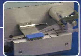
独自の剥離機構 Peeling with a constant angle